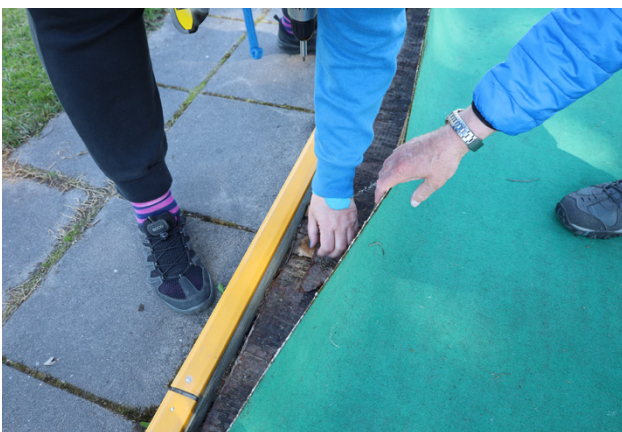
Banorna tog skada under översvämningen 2004. Nu ska de renoveras men det kostar.

Invid Norrvalla finns en minigolfbana som är i aktiv användning. Vi har träffat klubben som håller till där och de berättar om sin hobby.