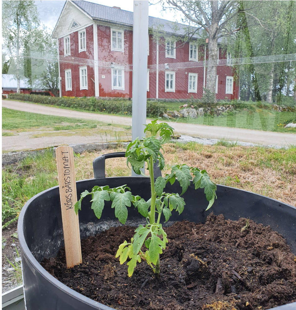
4H bjuder på en mängd olika egenaktiviteter i sommar.

Senare i sommar blir det också en till matskola, den kommer att ordnas för barn vid flyktingförläggningen i Oravais. "Matskolan är omtyckt, så det känns fint att kunna erbjuda barnen där samma lägerupplevelse som andra jämnåriga tar del av",