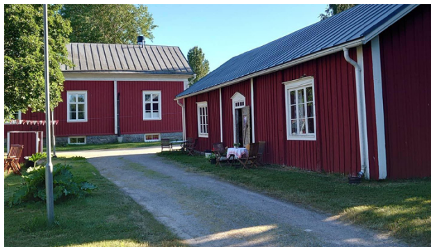
Bagarstugan byggdes i slutet av 1800-talet och låg egentligen inte där den ligger i dag.

– Och om vi tänker på hur många som var engagerade är antalet större. Vi stod i två timmars pass i bagarstugan,