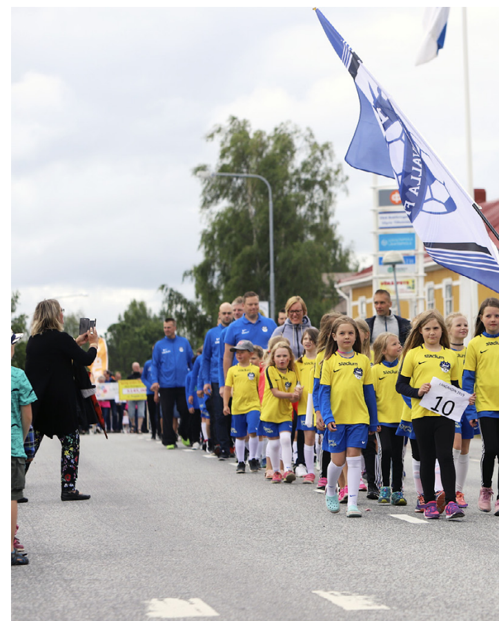
Bild från Vörådagarna 2019.