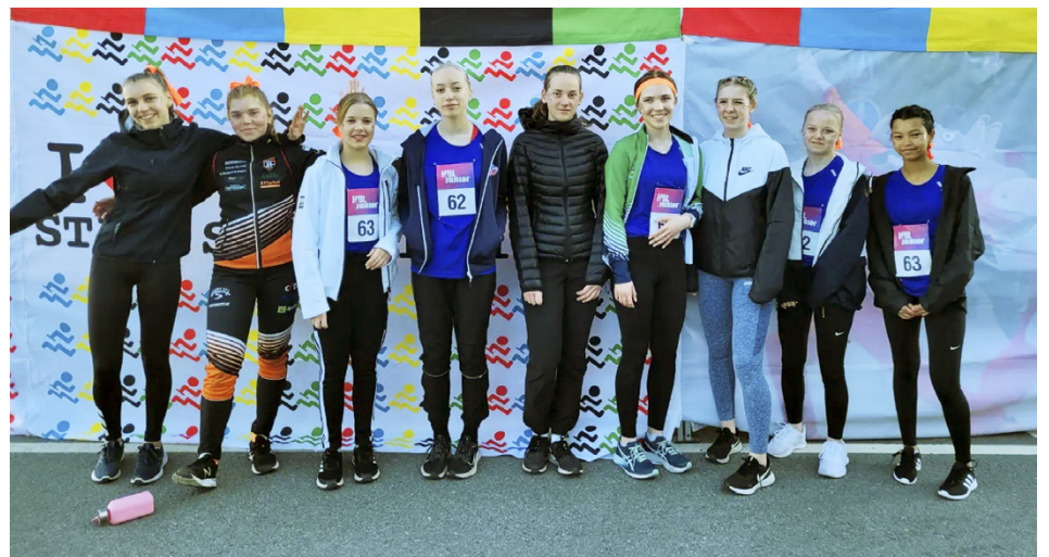
Flickornas 4x100m lag.

I bussen spelades musik, pratades och spelades kort. Vi stannade i Parkano på en liten paus. Efter pausen blev det lugnt i bussen och många av oss var så trötta efter en dag fylld av upplevelser så att vi sov resten av resan hem.