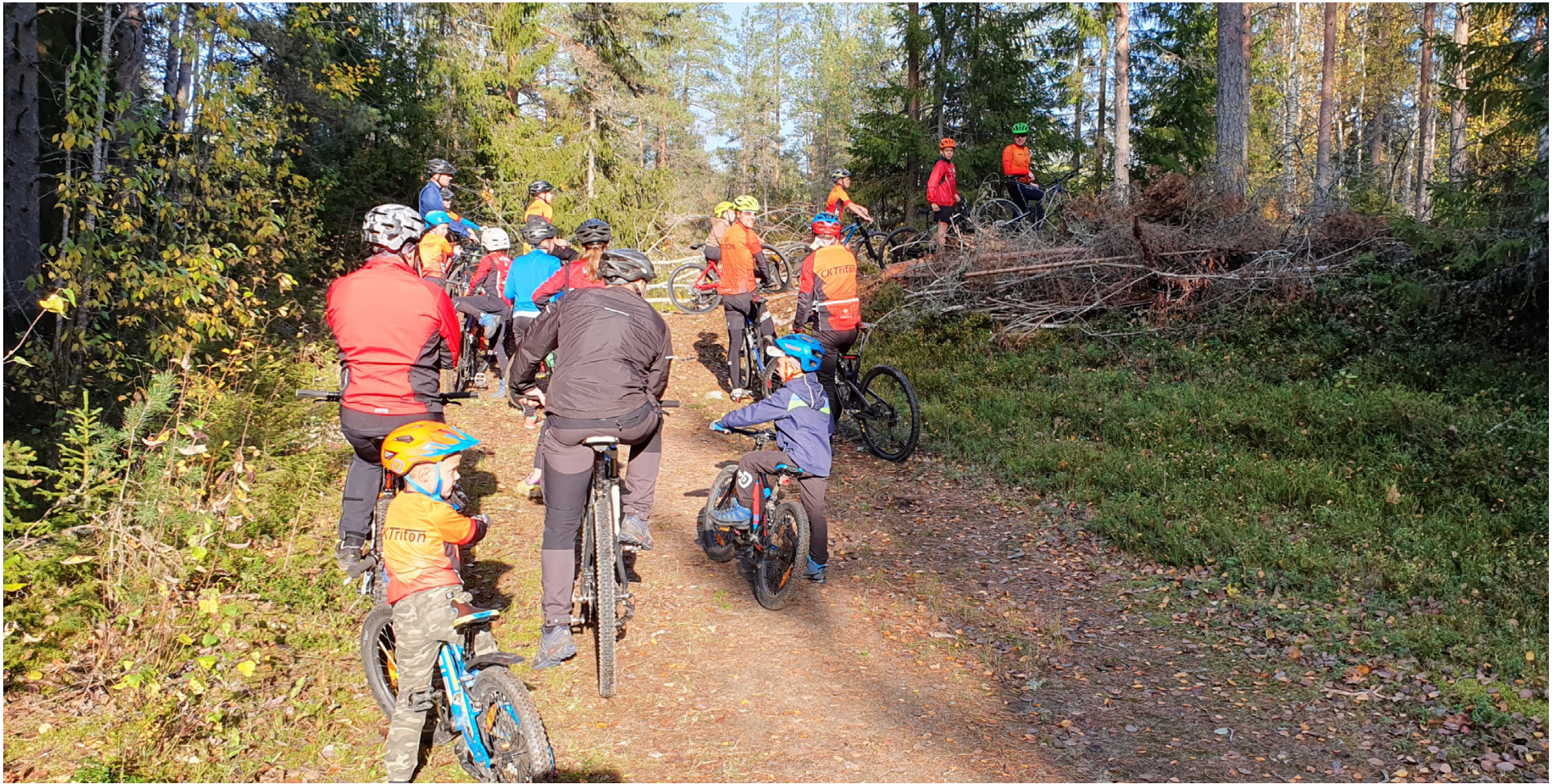
Både äldre och yngre deltar i cykelklubbens verksamhet.