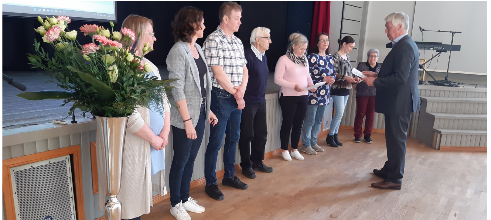
Utdelningsfesten hölls i Vörrå Ungdomsförenings lokal.

Vörrå Sparbanks Aktiastiftelse har i vår beviljat bidrag till ett belopp på 414 072 euro. Totalt 118 ansökningar godkändes. Bidrag har beviljats till elevstipendier, idrottsföre-