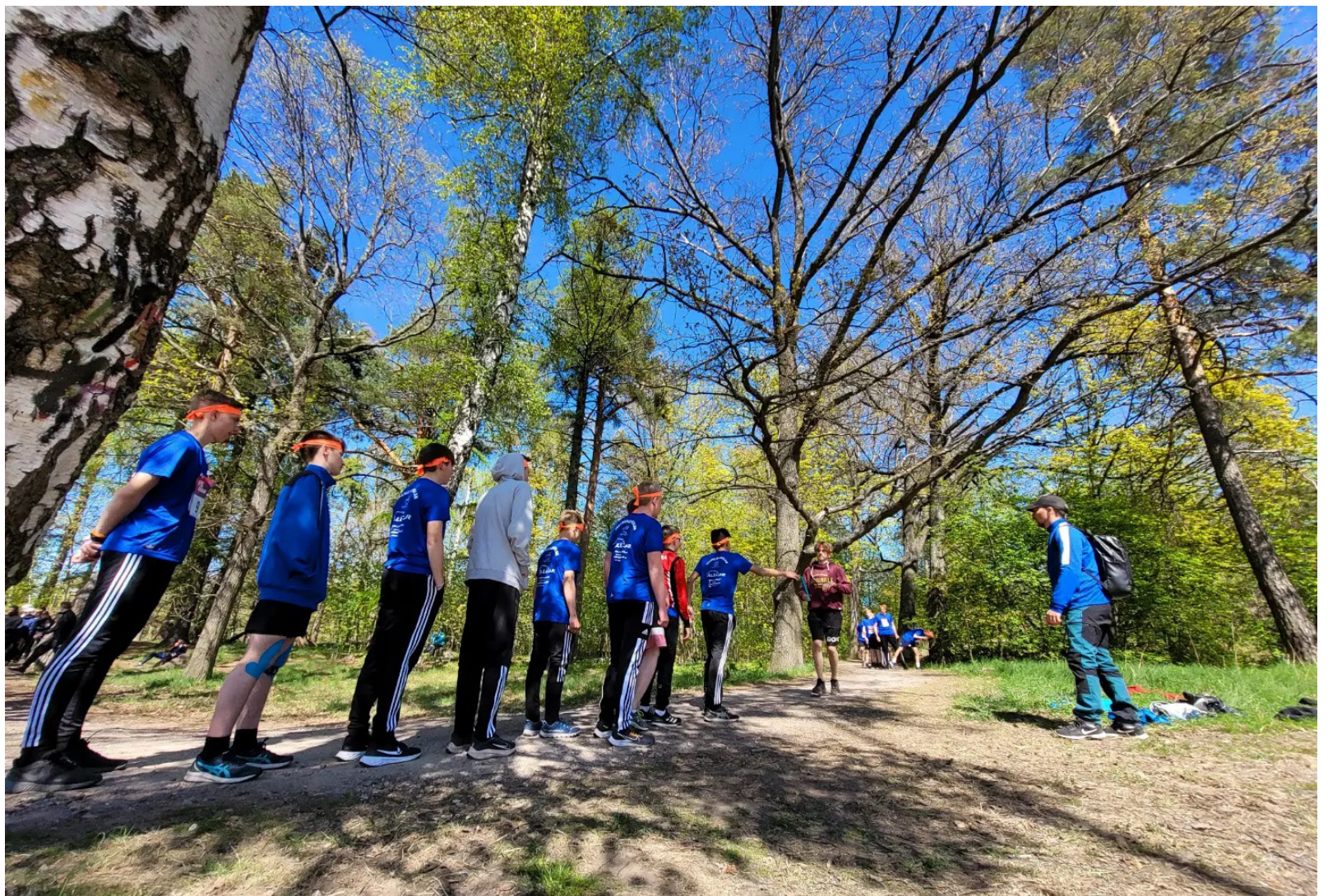
Pojkarnas masstafettlag på uppvärmning.

På hotellet fick vi våra rum och en egen rundvandring på hotellet. Klockan tickade fort och det blev dags att äntligen få sova i de sköna hotellsängarna.