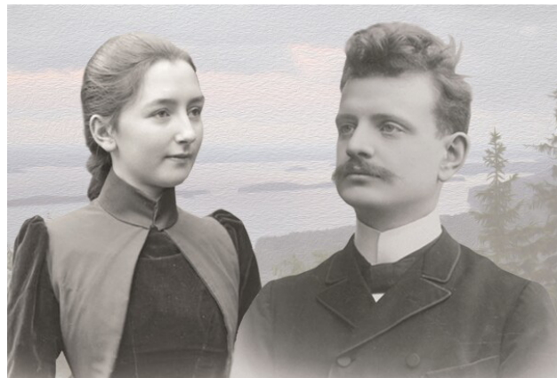
Aino och Jeans Sibelius gifte sig på Tottesunds herrgård 10.6.1892.