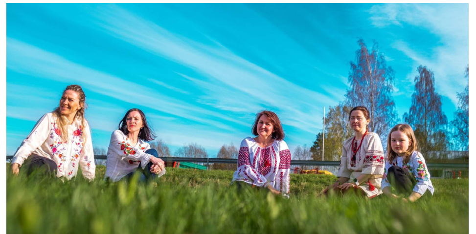
Nya vöråbor, med rötterna i Ukraina, bjuder på ukrainska läckerheter vid väncafé i Vörå den 9 juli.

Föreningen välkomnar nya medlemmar, aktiva som passiva.