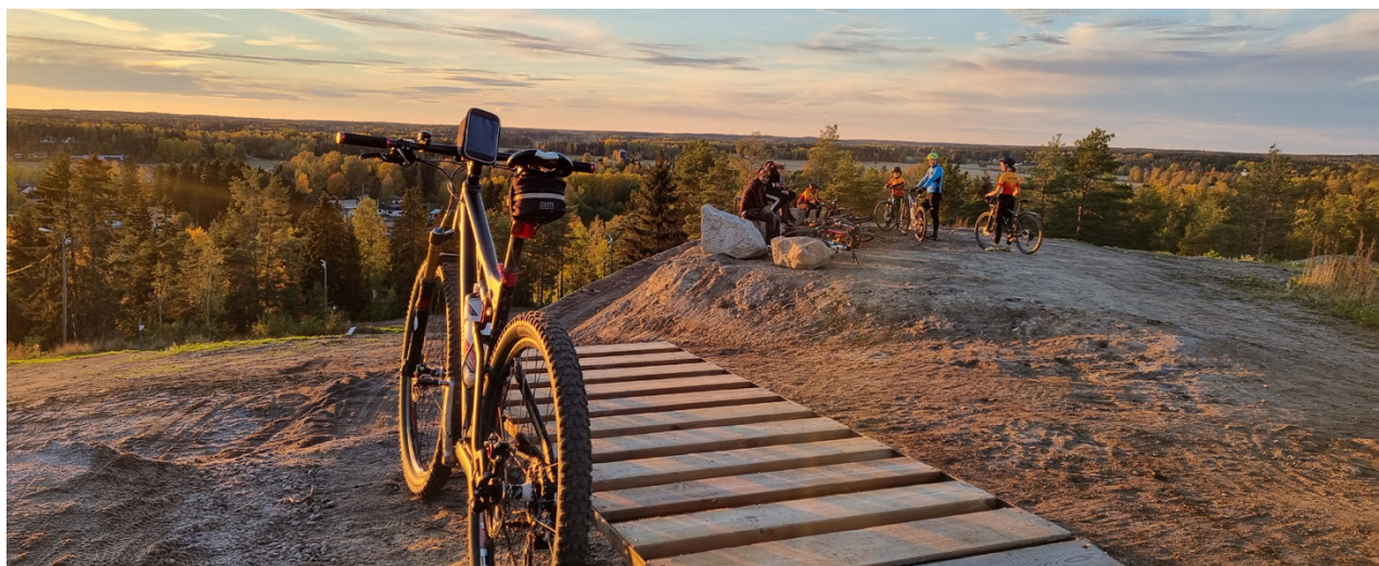
Cyklister kan få njuta av hisnande utsikter.

Förändringen är den att utvecklingen gått mera till terrängcykling och så började vi med juniorverksamhet 2015. Dessutom så underhåller och bygger vi stråk i skog och mark för cykling. Vi har ypperlig terräng här i Vörå för dylik sport. 2019 började vi dessutom bygga på Vörå MTB park vid skidcentrum och hoppas få den ganska långt klar i år. Det är en stor satsning som kunnat genomföras med stöd från våra stif-