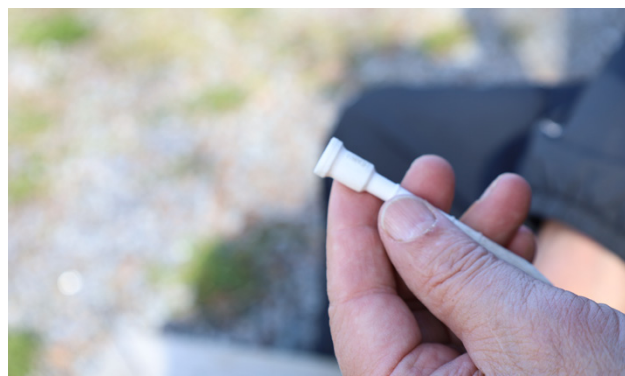
Bollen sätts på en sådan här peg innan man slår iväg den.

” Tidigare fanns det en klädkod i golfen, det sades bland annat att jeans inte passade sig, men i dag har man till stor del glömt det. Du kan komma som du är.”