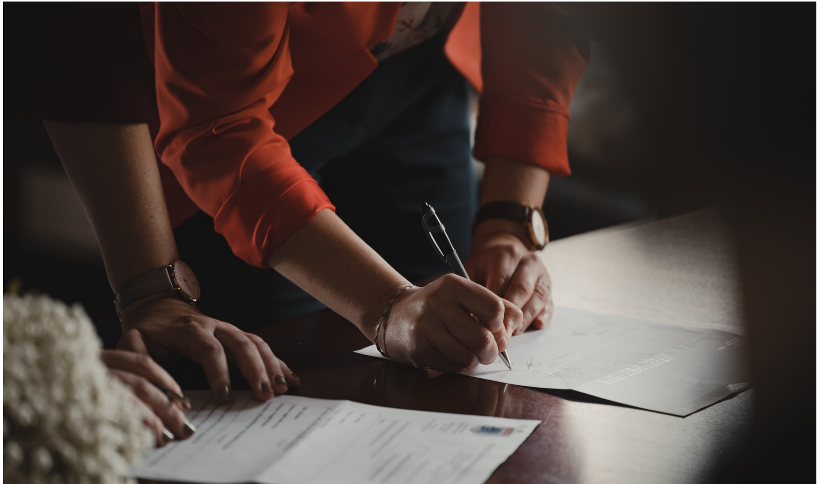
Det viktigt att alltid definiera i avtalet vad som är det rätta utfallet, dvs. vad som avtalas och när det kommer att levereras.

Arbetsavtalet är alltid i kraft tills vidare om inget annat har avtalats. Det måste alltid finnas en orsak för visstids-